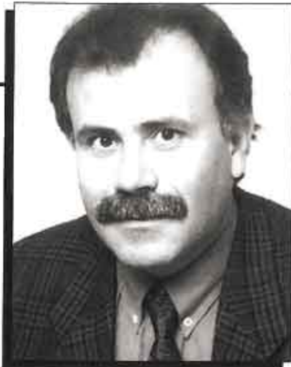
Ο Νίκος Διονυσόπουλος, ο γνωστός ερευνητής της παραδοσιακής μουσικής, ο επιμελητής της θανμάσιας έκδοσης «Λέσβος Αιολίς»...