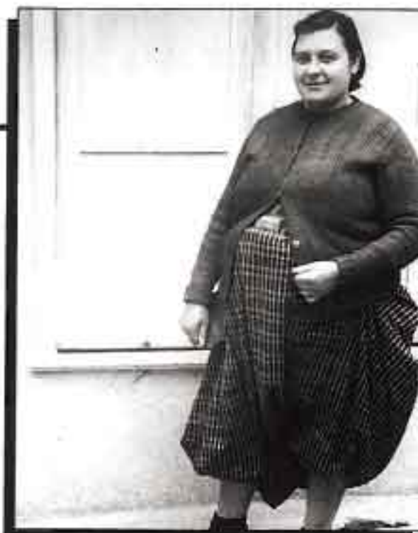
Αγιασώτισσα «βρακούσα» του 1963, όταν ακόμα υπήρχαν πολλές γυναίκες οι οποίες κρατούσαν την παραδοσιακή λεσβιακή φορεσιά...