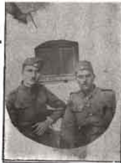
Ο Στρατός Λακωνία επί ο Ασιατικός Όρειος Βουνός στα Βαλτι Σέρου (20-6-1934)