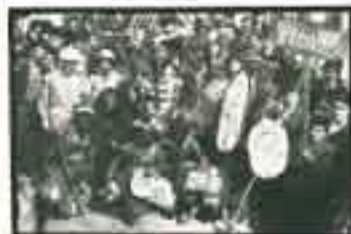
Από παλαιά καρναβαλική εκδήλωση στην Αγιάσο.