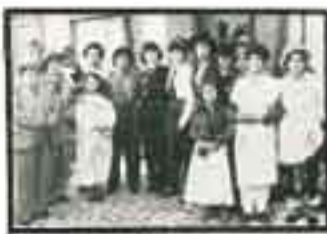
Το «καβένιο» φίλο μασκωμένο, εδώ και αρκετό χρόνο...